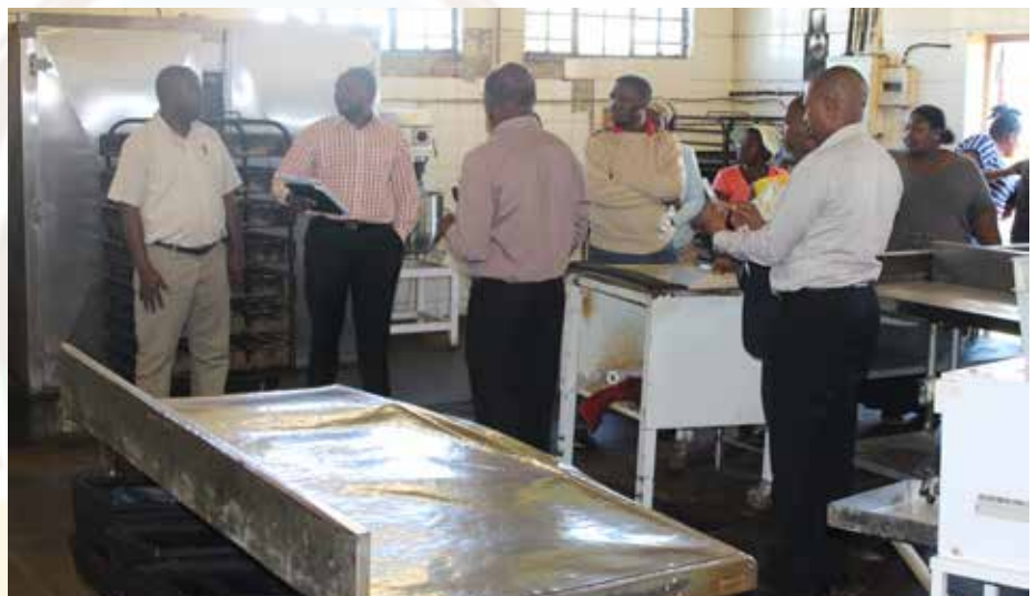
Ka hodimo: ho lekolwa sebaka sa pheba bobobe Mfundisweni Ntabankulu