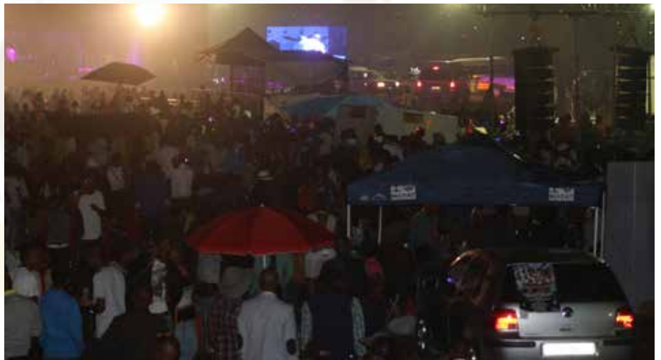
Ka hodimo: dinonyana didula batho