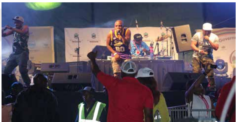
Ka hodimo: Professor o etsa seo bamoratelang sona