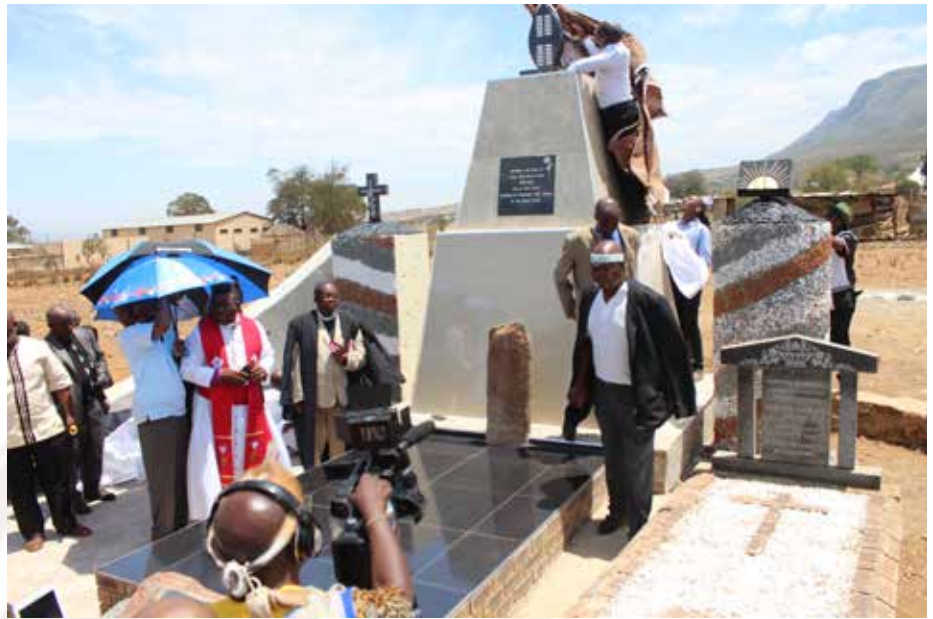
Ka bodimo: pulo ya lejwe Ndzongiseni e Mt Ayliff ho hopola morena Fikeni le bafumahadi babae.

“ka nako tse ding renale ho lebala karolo e bapalwang ke mafumahadi, borakgadi