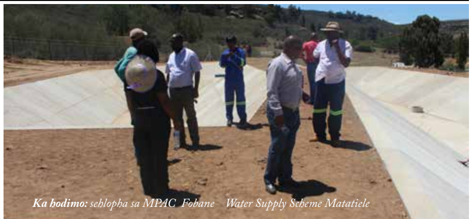
Ka hodimo: sehlopha sa MPAC Fobane Water Supply Scheme Matatiele

Ha e le Ntabankulu ho etetswe sebaka seo ho ntlafatswang sebaka sa dikgwerekgwere le phepele ya metsi Nyokweni/Bomvini e se e le mokgahlelong wa bobedi. Modula Setulo wa MPAC o re tlaleho batla e fitisetsa ho Lekgotla honka qeto ditshisinyong tse teng.