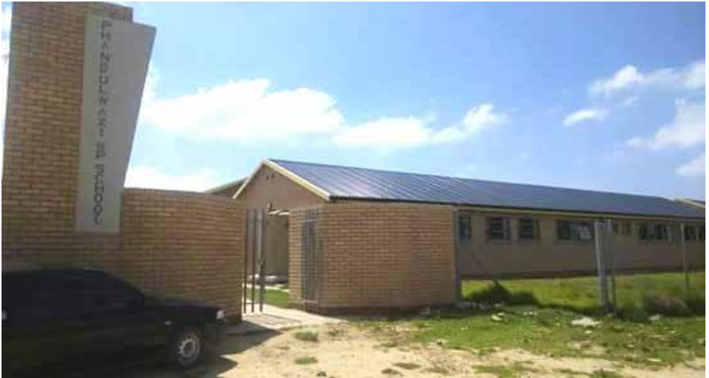
Ka hodimo: sekolo seqetwang ho abuwa Phandulwazi Senior Primary School

Baithuti bafetang 500 ba iphumana ba le ka hara diphaphusi tsentjha ka mora hore lefapha la thuto le ahe sekolo sa Phandulwazi SPS se motsaneng wa ha Madiba Mbizana jwalo ka karolo ya isa thuto mahaeng.