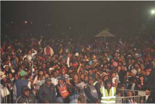
Ka bodimo: letshwele le tleleng moketeng wa mmino Matatiele.