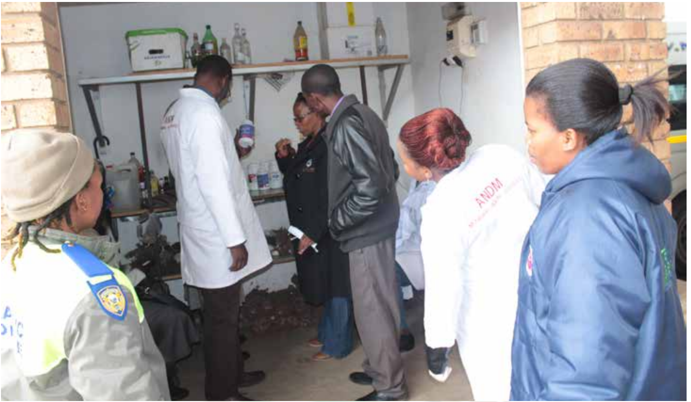
Ka bodimo: Municipal Health Services (MHS) ba etela borakgwebo Mbizana.

Ho latela dipalo tse hodimo tsa batho ba amanywang le hoja dijo tse nang le tjhefo tse ntshitsweng ke lefapha la bophelobotle haholo sepetleleng sa St Patrick se Mbizana sena sesosmeditse masepala hotswa letsholo la ho lemosa setjhaba a sebedisana le mekgatlo e amehang.