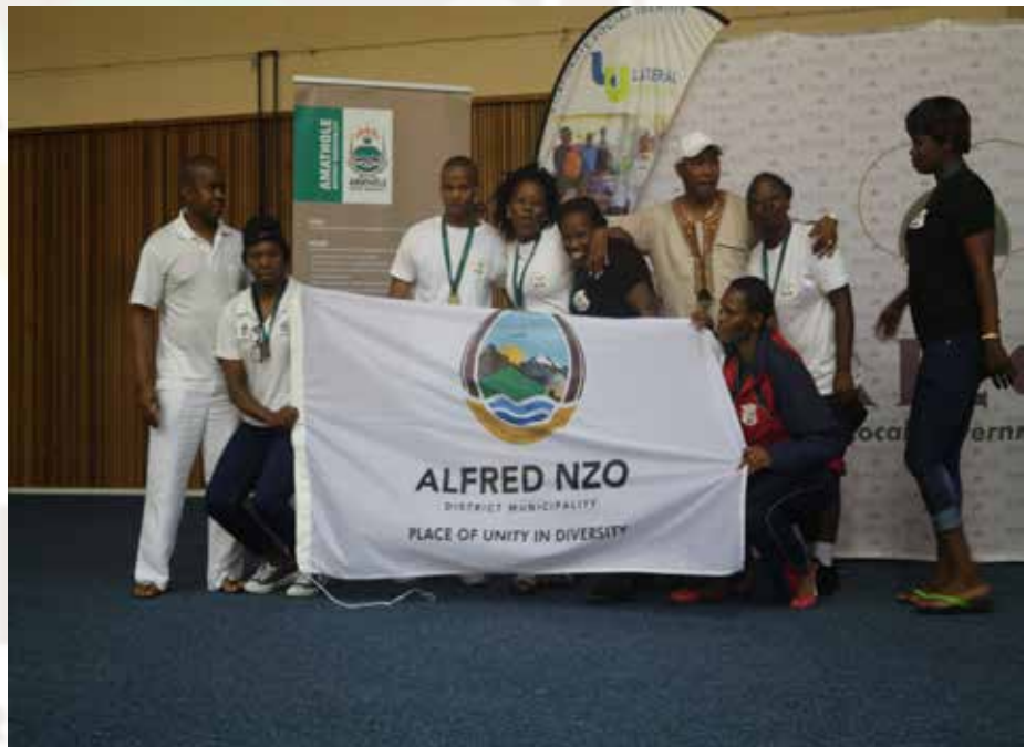
Ka hodimo: sehlopha sa Alfred Nzo sa netball se iphumanetsi dimetale ka mora dipapadi tsena.