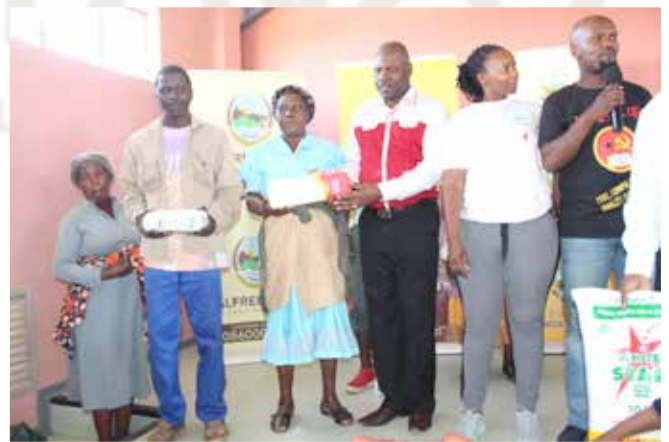
Ka bodimo: motlatsi wa majoro wa phethahatso o fana ka dijo setjhabe—ng ka le tsatsi la matjhaba la Phamokate motsaneng wa Moaneng Matatiele .