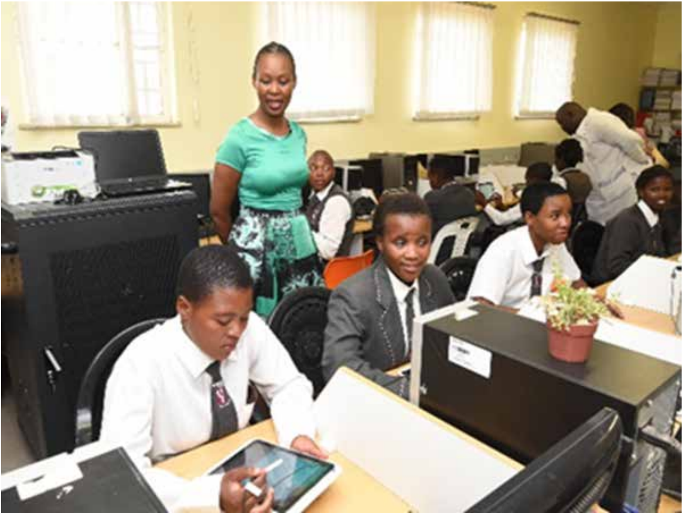
Baithuti ba 5 baka sehloobong ba St Georges bafumana dibasare

“e ba Mandela wa nako ya hao ka seo o nang lesona”. Ao e bile mantswe a motlatsa letona la tsa dikgokahanyo, Stella Ndabeni Abrahams a wa lebisane ho baithuti ba St Georges Senior Secondary School nakong ya letsholo la ho kgutlela sekolong le neng le le Mount Frere haofe.