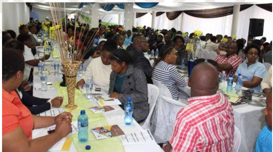
Ka bodimo: basebetsi ba bokane phaphosing ya seboka ka letsatsi la bareki.