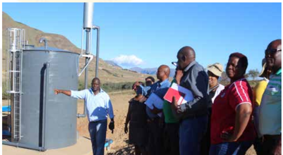
Ka hodimo: sehlopha sa MPAC se lekola Ntibane/Mkbemane water scheme Mount Frere