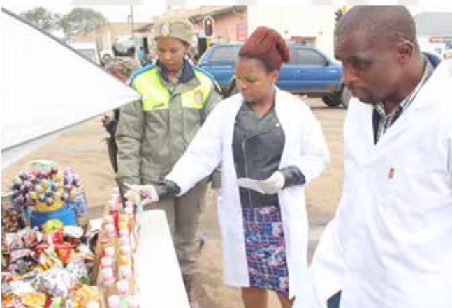
Ka bodimo: ditsebi ho tsa bophelo bobotle masepaleng ba lemosa batho renkeng ya ditekesi.