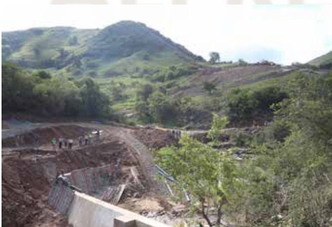
Ka hodimo: phepelo ya metsi Bomoini/Nyokweni e ntse e lokiswa.