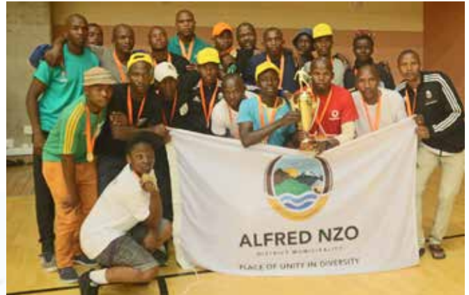
Ka hodimo: sehlopha sa ANDM sa bolo setshwere mobope dipapading tsa SALGA tse neng dile Alice