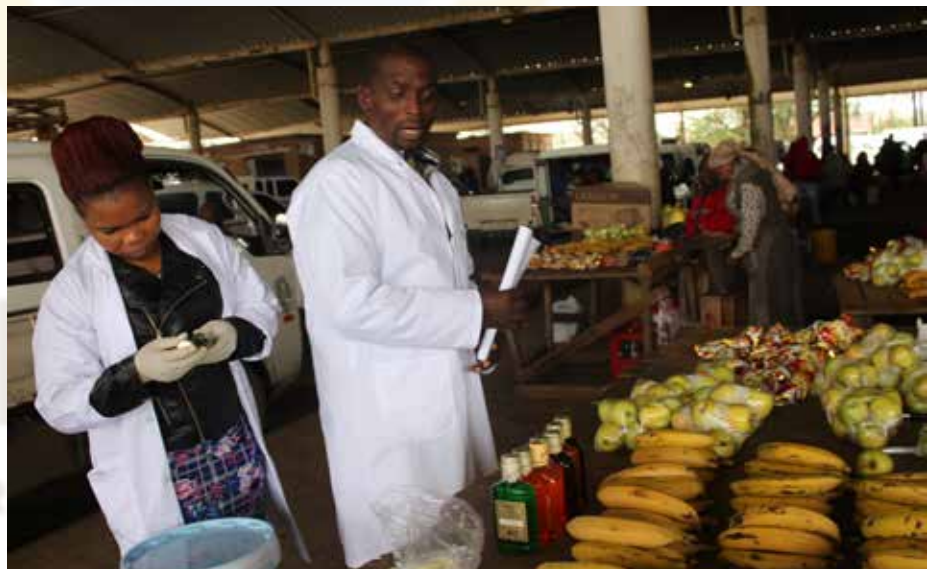
Ka bodimo: Municipal Health Services baruta barekise kotsi ya ho kopanya dijo le dintho tse sa jweng

rekisa pela renke ya ditekesi o lebohetse temoso ena hobane o ne a sa tsebe kotsi ya ho beha dintho tsekang glycerin le tipi pela ditholwana.