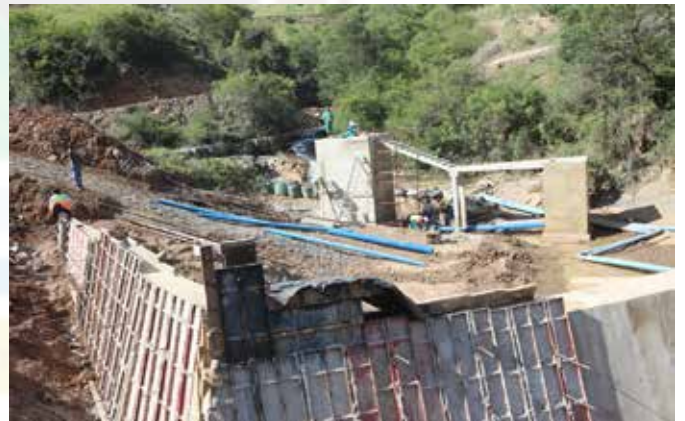
Ka bodimo: sebaka sa phepele ya metsi Bomvini / Nyokweni seo setla tlesang metsi a hlwekileng setjhabeng sa Ntabankulu.