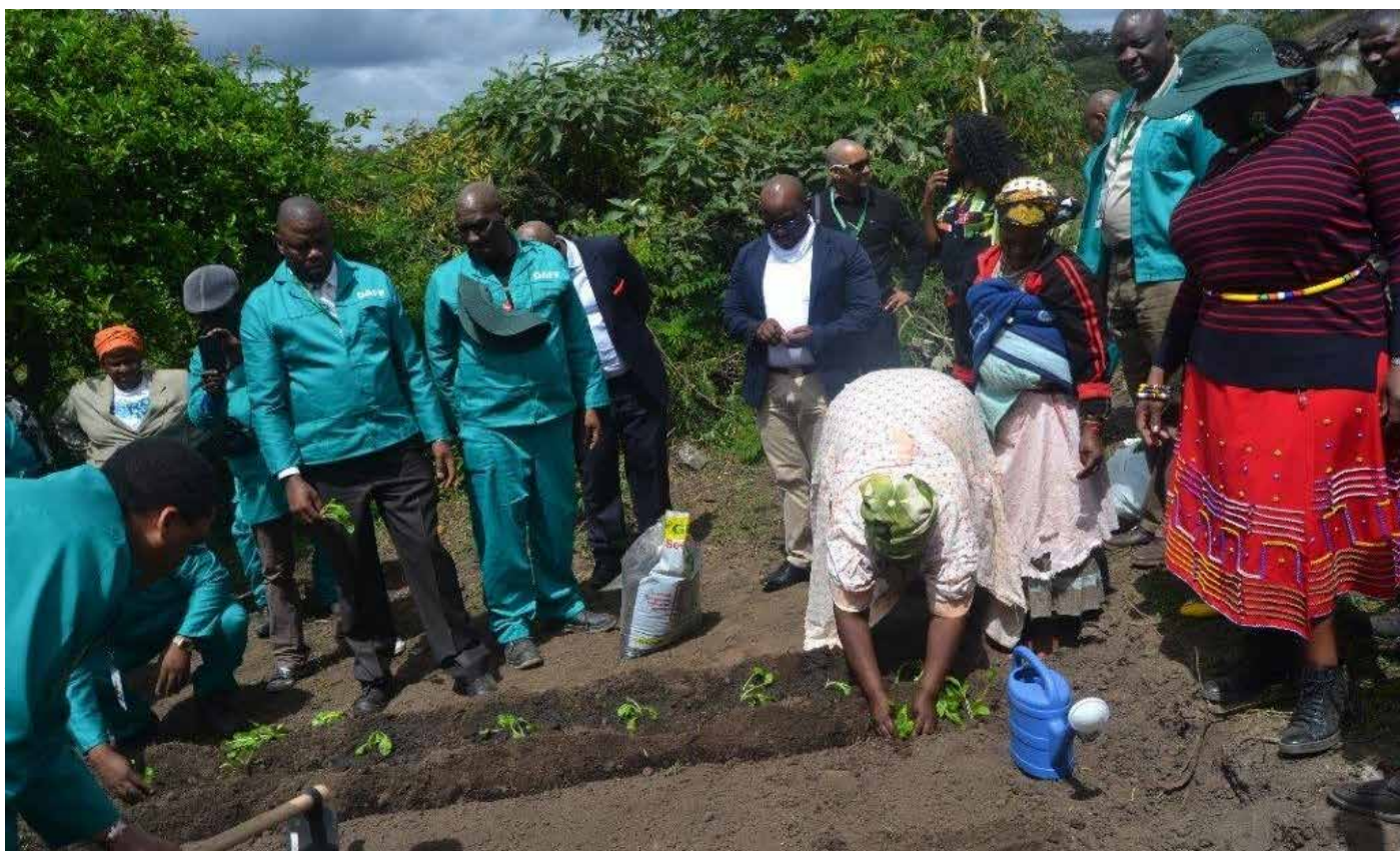
Ka bodimo: boradipolotiki ba Kenya dithopo Mbongweni Mbizana.

Mmuso le mokgatlo ya setjhaba batswele tjaro ya mabonwa ho lwantsha bofuma bo aparetseng dibaka tsa mahaeng. Sena seetsahala motsaneng wa Mbongweni Mbizana ka letsatsi la matjhaba la dijo mme lepetjo la monongwaha lere Tshireletso ya Setjhaba le Temo: twantshong ya bofuma”. Mafapha akang: latemo, Lameru le tshwaso ya ditlhapi, Ntshetsopele ya mahaeng le puisetso ya mobu, Masepala wa setereke Alfred Nzo le masepala wa Mbizana atheohetsi motsaneng wa Mbonweni hotla keteka letsatsi lena.